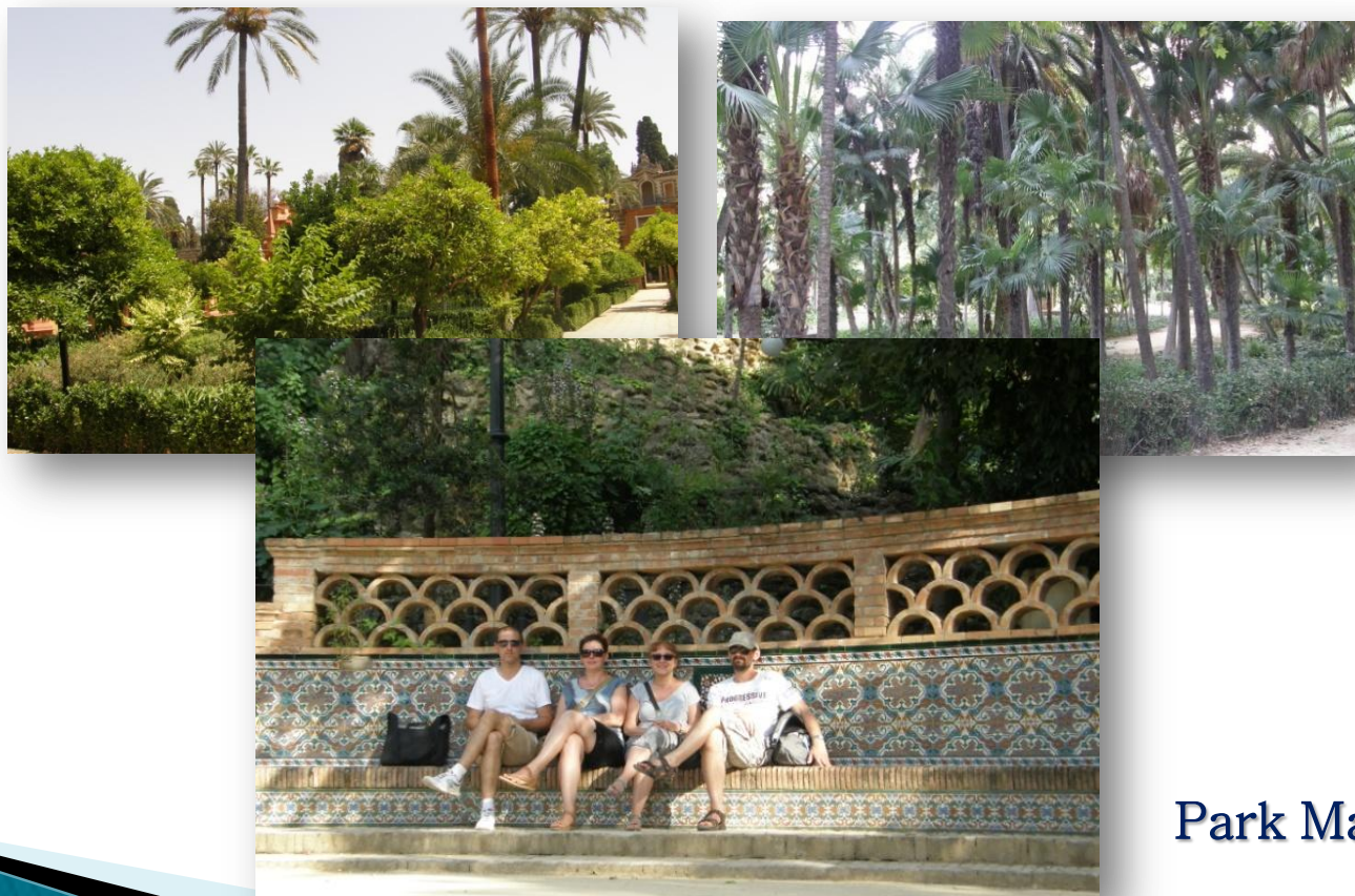
Park Maria Luisa

Po zajęciach był czas na zwiedzanie SeVilli.