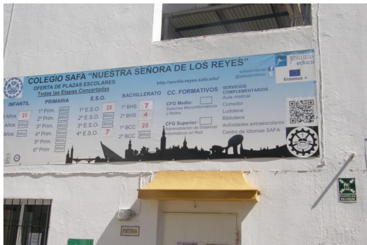
System edukacji w Hiszpanii - schemat

28.05.2017r. SAFA. Spotkanie organizacyjne. Wprowadzenie do hiszpańskiego systemu edukacji.