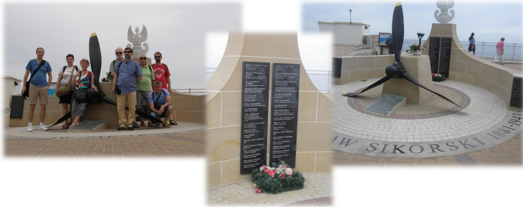
The Sikorski Memorial