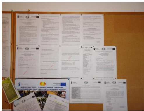
Tablica ogłoszeń w pokoju nauczycielskim

Nim jednak 16 nauczycieli wyjechało na szkolenia, czekało ich wiele godzin przygotowań. We wrześniu, po ogłoszeniu informacji o naborze do projektu nauczyciele przygotowywali Formularze aplikacyjne.